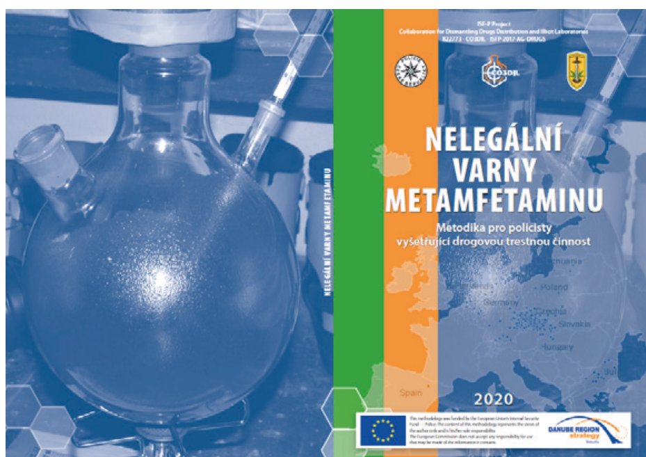
Obr. 3 – úvodní stránka metodické příručky CO3DIL

Projekt CO3DIL v průběhu svého krátkého života nabídl evropským orgánům vymáhajícím právo dočasnou platformu pro potlačování nelegální produkce a obchodu s metamfetaminem, včetně prekurzorů. Vytvořil reálné příležitosti k podpoře přímé operativní spolupráce a podpořil dlouhodobě existující pracovní skupiny orientující se na problematiku metamfetaminu, jako např. pracovní skupinu CRYSTAL nebo EMPACT. Členové těchto