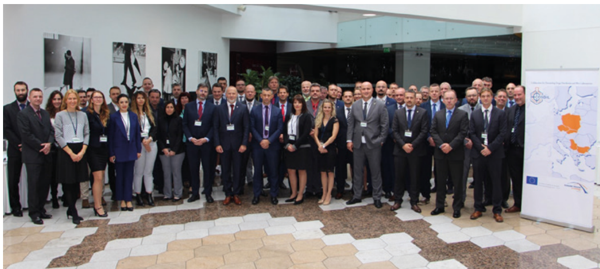
Obr. 4 – fotografie ze závěrečné konference CO3DIL v Praze roku 2021