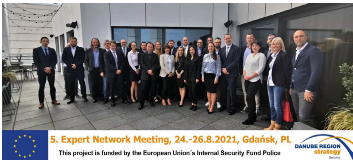
Obr. 2 – expertní setkání CO3DIL v polském Gdaňsku

V rámci projektu byl určitý prostor věnován i sběru a prezentace dat z oblasti vymáhání práva. V rámci této části byl na expertním setkání a pak i následně na závěrečné konferenci představen projekt Národní protidrogové centrály zaměřený na interaktivní mapy obsahující údaje k odhaleným laboratořím na výrobu metamfetaminu a také k odhaleným pěstírnám. Systém fungující v rám-