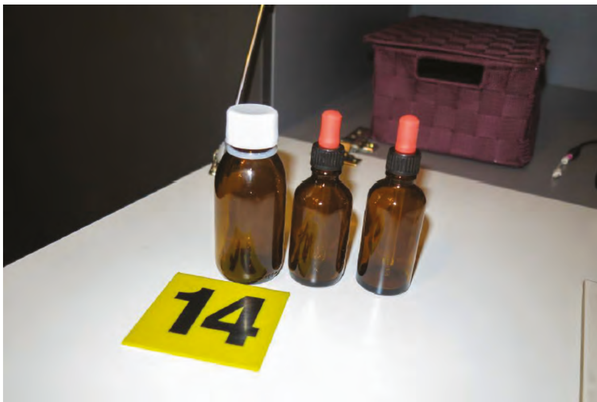
Obr. 2 – Skleněné lahvičky s dávkovací pipetou se zbytky GHB