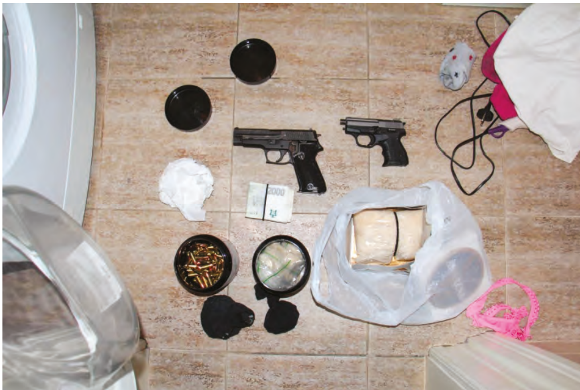
Obr. 1 – Zbraně, munice, hotovost a 745 g metamfetaminu zajištěných u A.H. v březnu 2021 v Airbnb bytě na Praze 1

žili pachatelé drogové trestné činnosti. Možnost rychle měnit svůj pobyt, místo, odkud lze prodávat drogy anebo je vyrábět, to vše významně napomáhá konspirovat trestnou činnost a snížit tak riziko svého odhalení.