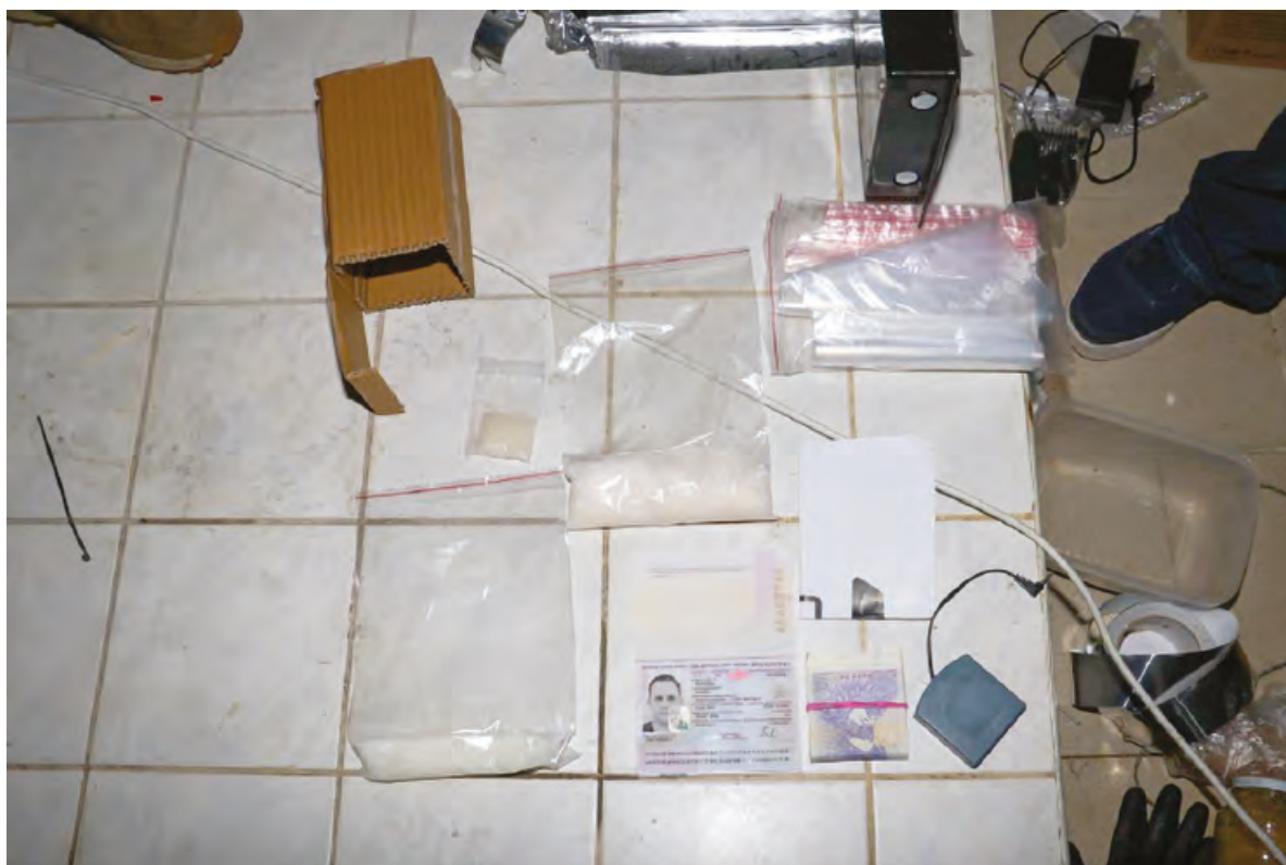
Obr. 3 – Obsah trezoru s 279 g brutto metamfetaminu

kde si domlouval schůzky s odběrateli pomocí privátního chatu.