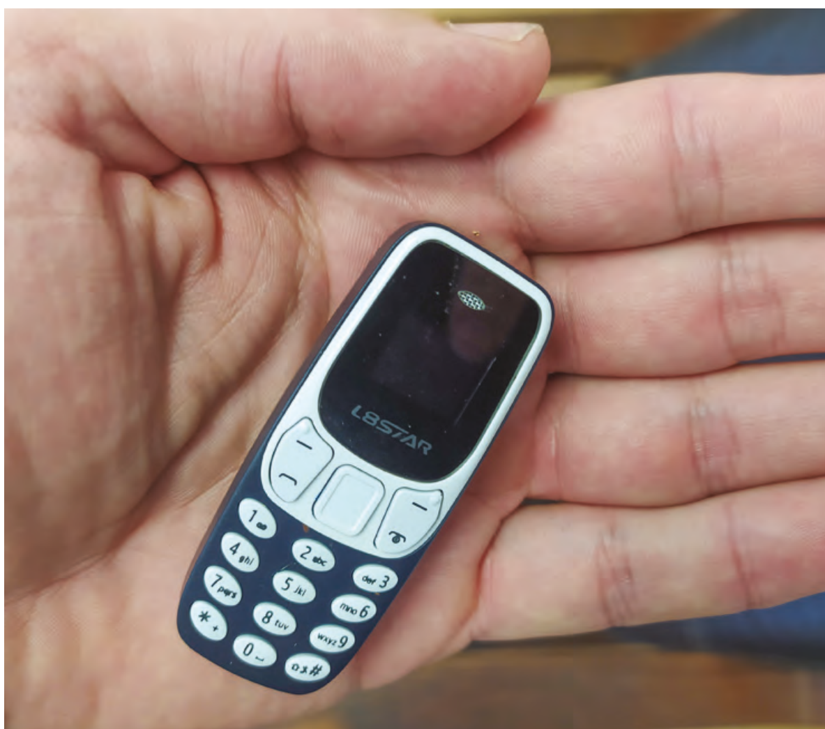
Obr. 4 – mobilní telefon L8STAR