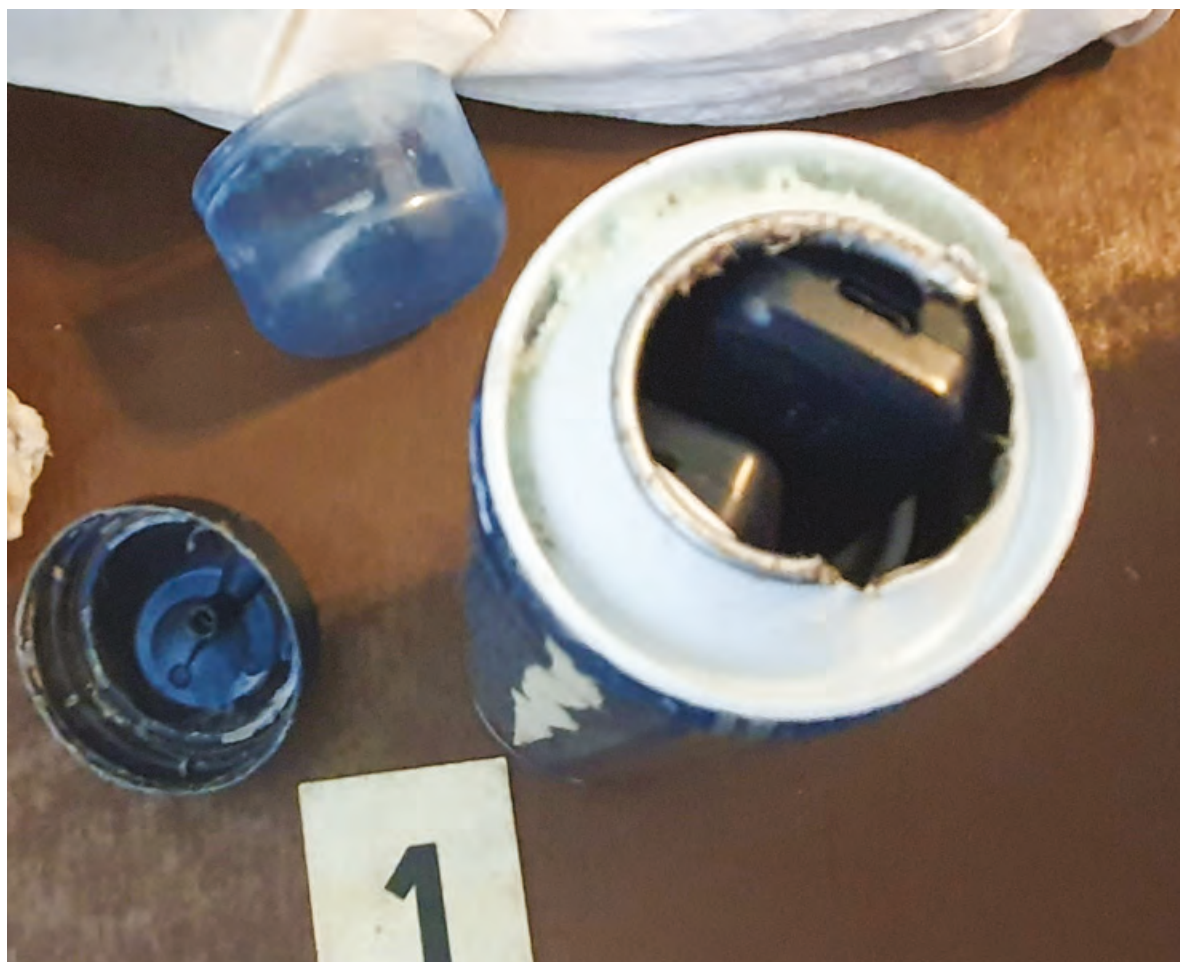
Obr. 1 – mobilní telefon ukrytý v zaslaném balíku

trestné činnosti, jejíž specifika modeluje režim výkonu trestu odnětí svobody. Způsob pronesu mobilního zařízení do prostředí věznice záleží na umístění cílového subjektu a konkrétním zabezpečení střeženého prostoru věznice.