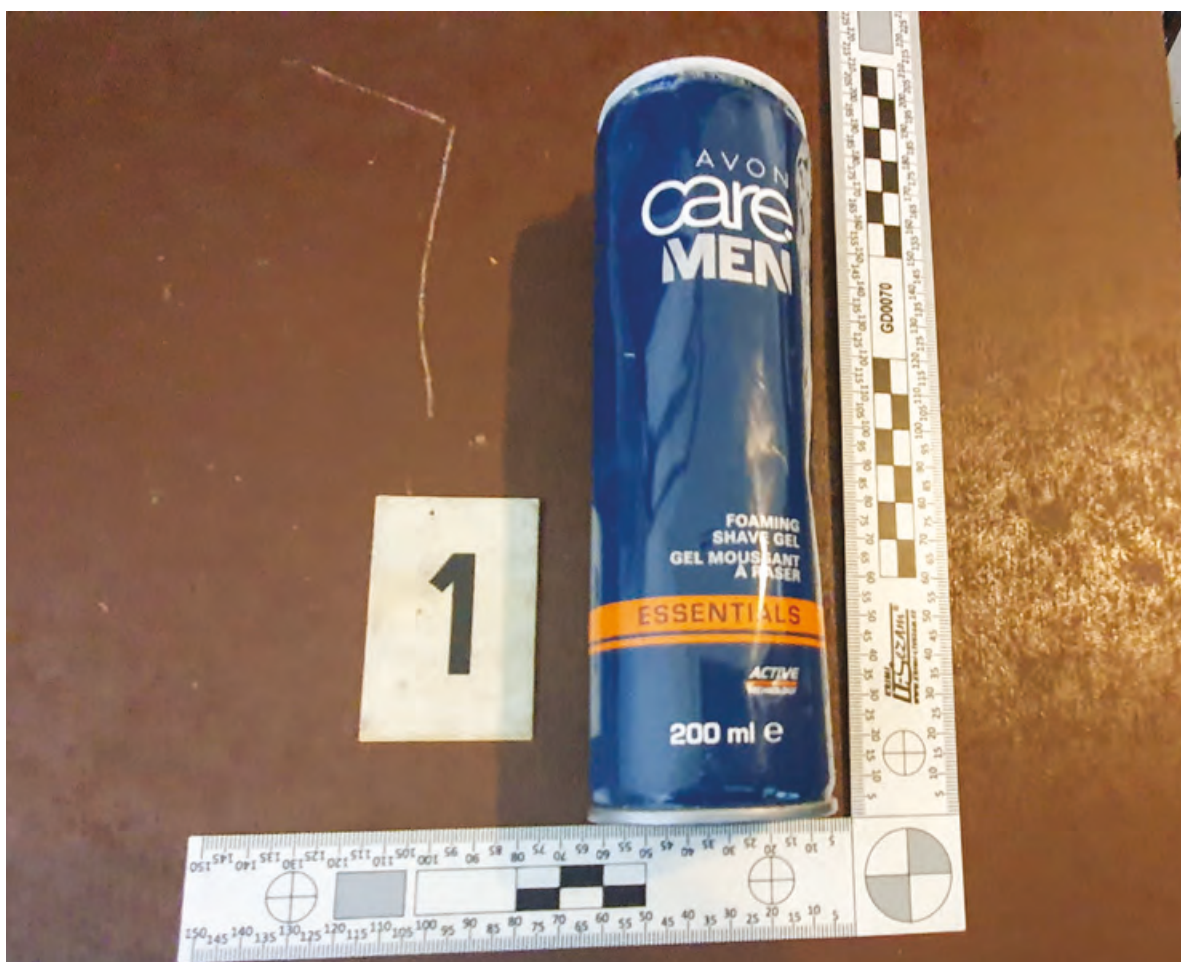
Obr. 2 – mobilní telefon ukrytý v zaslaném balíku

č. 345/1999 Sb., kterou se vydává řád výkonu trestu odnětí svobody, je odsouzený povinen kdykoliv umožnit zaměstnanci Vězeňské služby provést kontrolu svých osobních věcí). V případě nalezení příslušníky VS ČR tak dochází k minimalizaci rizika, že nalezený telefon bude přiřazen ke konkrétnímu odsouzenému. Většinou tak dochází k ukrytí telefonu ve společenských místnostech, společných toaletách nebo umývárkách. Úkryty pro mobilní zařízení jsou rozmanité, často velmi důmyslné, zasahující do stavebně technických prostor budovy věznice.