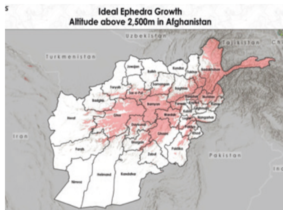
Obr. 2, 3 - Rostlina efedra (chvojník) a místa kde se jí v Afghánistánu nejvíce daří. 3