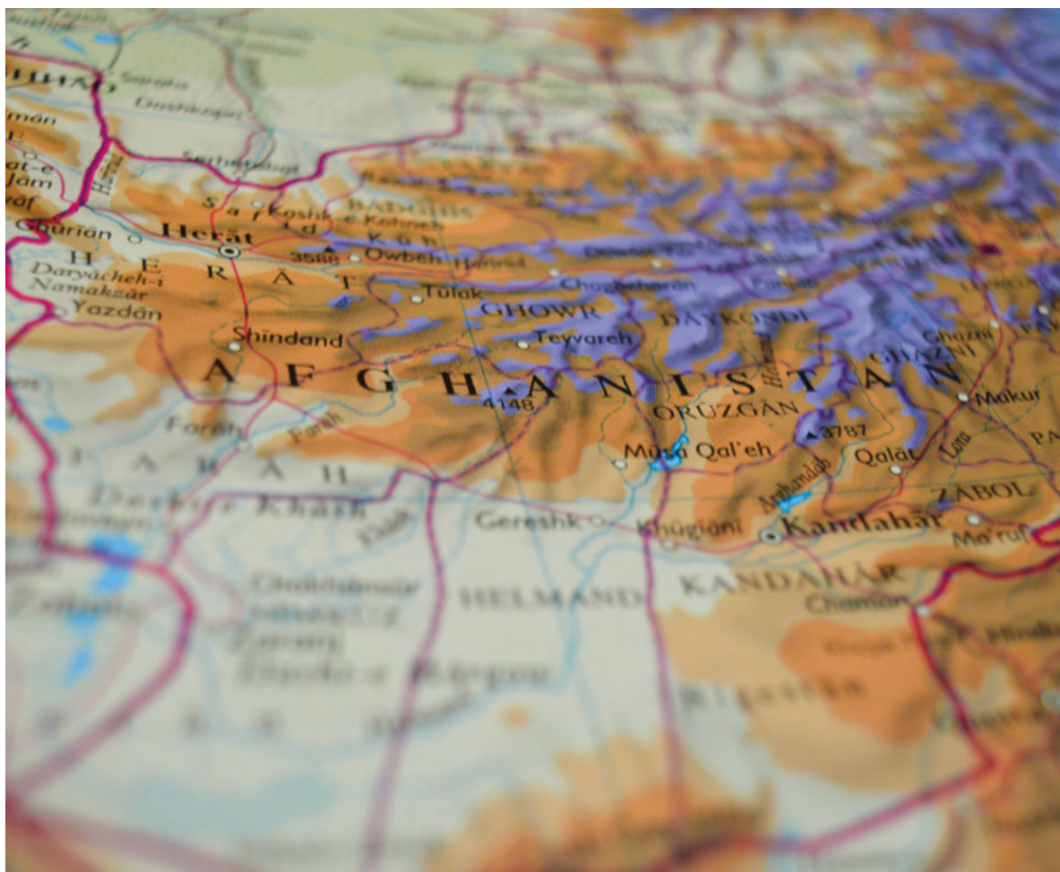
Obr. 1 - ilustrativní náhled na plastickou mapu Afghánistánu

ná a dle se prohlubuje. Chudobou je ohroženo až 97 % populace. Více než polovina dětí mladších pěti let čelili akutní podvýživě.